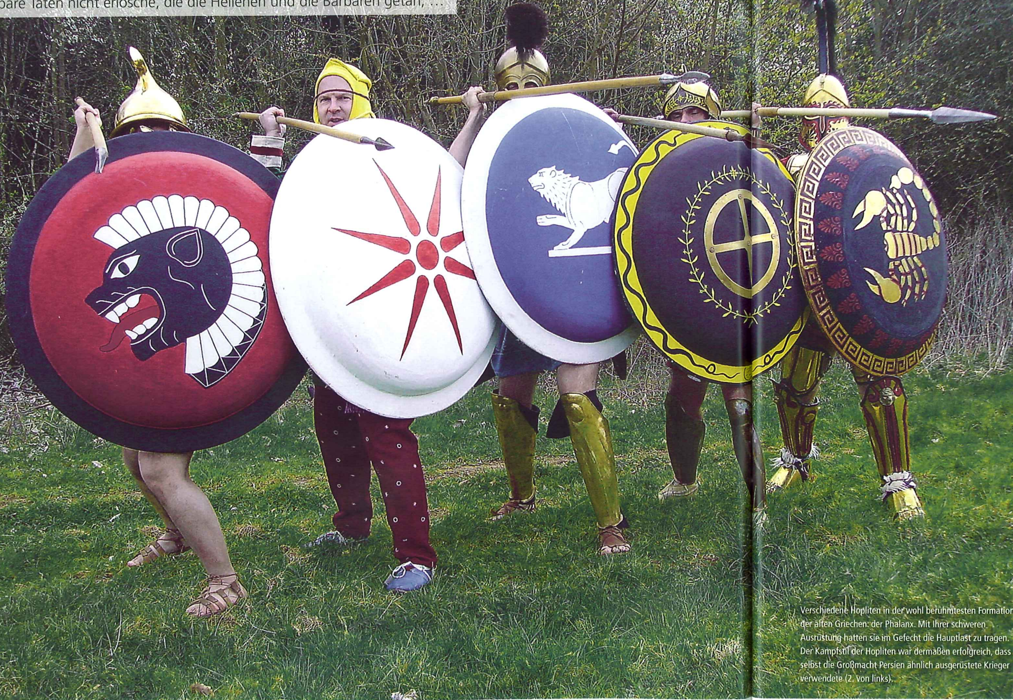
Verschiedene Hopliten in der wohl berühmtesten Formation der alten Griechen: der Phalanx. Mit ihrer schweren Ausrüstung hatten sie im Gefecht die Hauptlast zu tragen. Der Kampfstil der Hopliten war dermaßen erfolgreich, dass selbst die Großmacht Persien ähnlich ausgerüstete Krieger verwendete (2. von links).

„... damit bei der Nachwelt nicht in Vergessenheit gerate, was unter den Menschen einst geschehen, damit das Andenken an große und wunderbare Taten nicht erlösche, die die Hellenen und die Barbaren getan, ...“