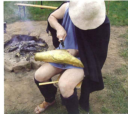
Bei Vorbereitungslagern ergeben sich immer auch Gelegenheiten um an der Ausrüstung zu arbeiten. Hier letzte Feinarbeiten an einer Beinschiene.

Als die ersten unserer Mitglieder sich an das Projekt wagten, war die Beschaffung von Ausrüstungsteilen eine wirkliche Herausforderung. Da die griechische Antike im Reenactment eher ein kaum beachtetes Randgebiet war, war geeignetes Material auf dem Markt entsprechend dünn gesät. Zwar waren einige wenige Reproduktionen von Helmen, Schwertern etc. zu finden, doch waren diese