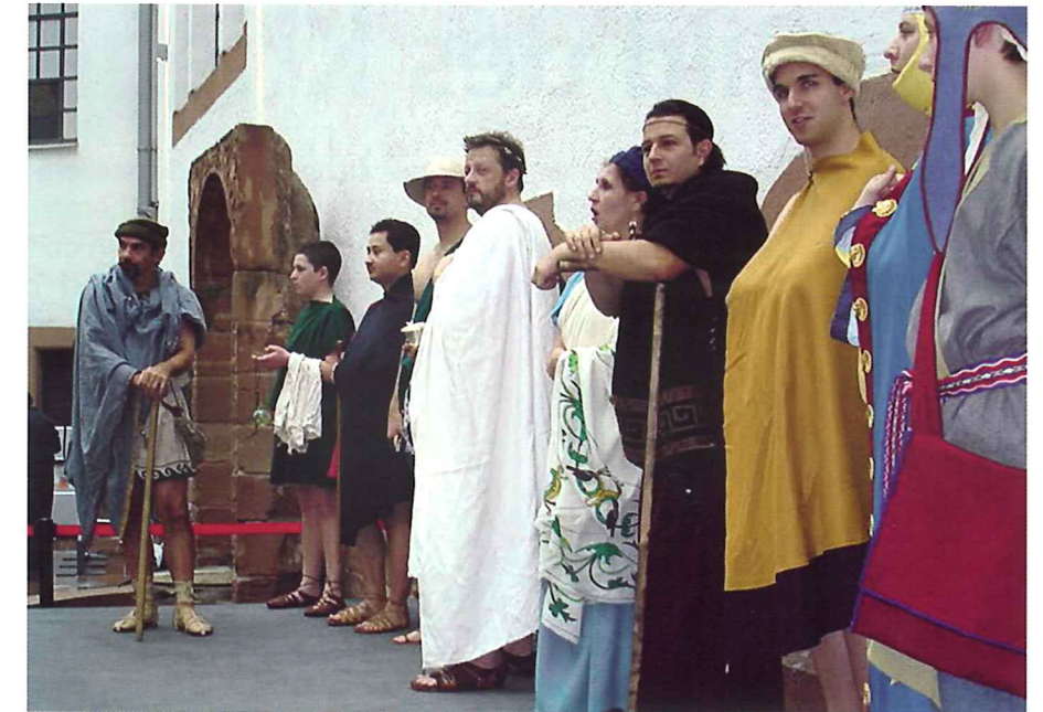
Mitglieder der Hetairoi in antiker Zivilmode bei einer Vorführung im Historischen Museum der Pfalz in Speyer.

Bei unseren Vorführungen beschränken wir uns zumeist auf das Vorführen und Erklären der Ausrüstungen und Bekleidung oder das Exerzieren. Schaukämpfe lehnen wir dagegen ab. Zwar legen wir Wert darauf, dass jedes Mitglied sich mit der korrekten Handhabung seiner Waffen auskennt, jedoch halten wir die Risiken wie sie bei Schaukämp-