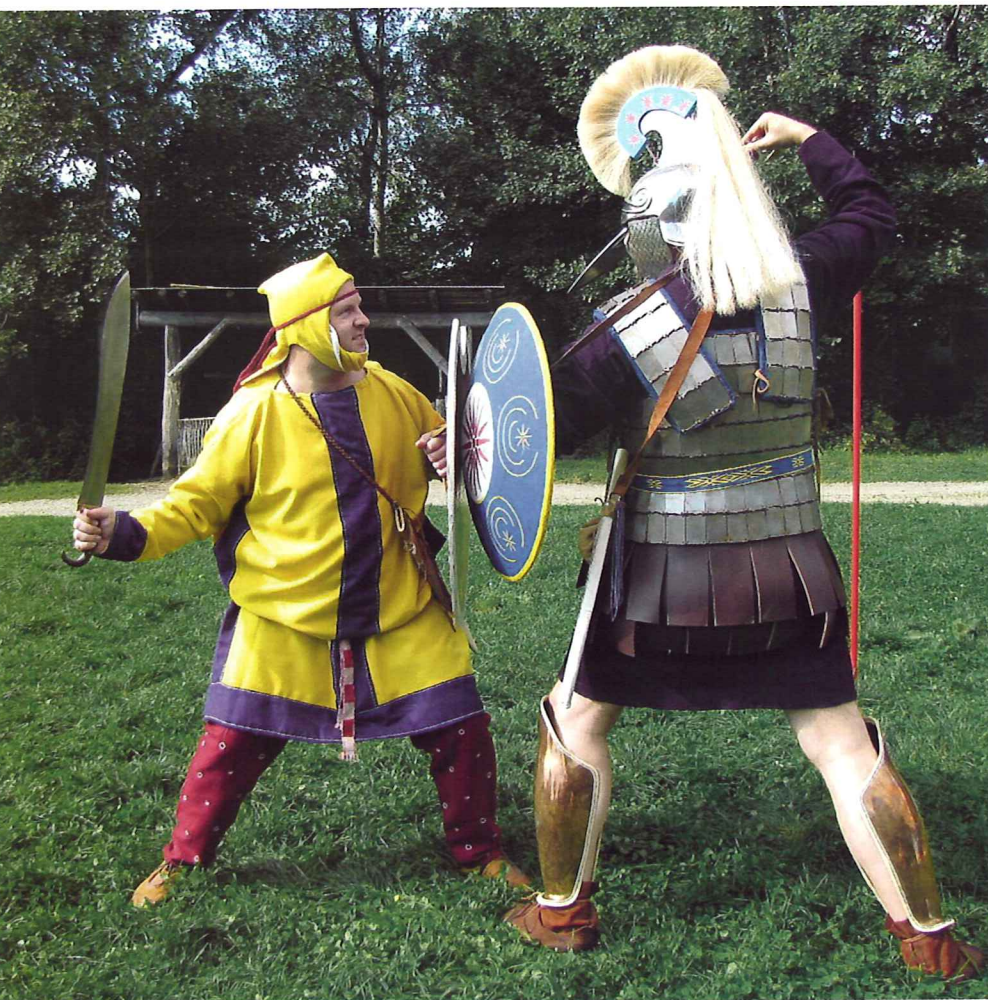
Zweikampf eines makedonischen Phalangiten mit einem leicht gerüsteten Perser. Solche Szenen dürften sich zur Zeit Alexanders des Großen auf den Schlachtfeldern häufiger ergeben haben.

Seitdem sind die Hetairoi in diversen Museen im In- und Ausland zu Gast gewesen um in Verbindung mit Ausstellungen oder Events Geschichte zum Anfassen zu bieten; bis dato stets mit positiver Resonanz.